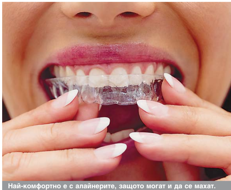
Най-комфортно е с алайнерите, защото могат и да се махат.

И Имаш брекети? На 10 ли си? Не, в тренда съм. Този диалог може да се чуе вече между хора над 40 г. Все по-често майки и бащи слагат брекети или алайнери заедно с децата си. Статистиката сочи, че 20% от хората в света с брекети са възрастни. И е логично, ако е вярно, че само 35 на сто от населението над 20 г. има правилно подредени зъби. Ако вие или детето ви се нуждаете от коригиращи ус-