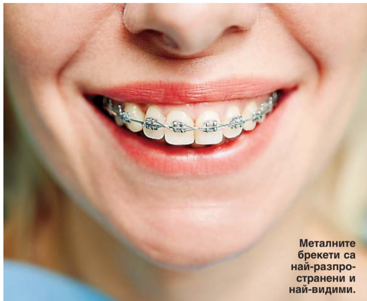
Металните брекети са най-разпространени и най-видими.